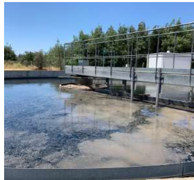
TRATAMIENTO DE AGUA