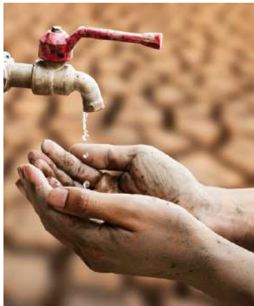
Identificación de oportunidades

Trabajamos a diario para desarrollar proyectos rentables y sostenibles, tanto para clientes municipales como industriales, garantizando el cumplimiento de las expectativas del cliente.