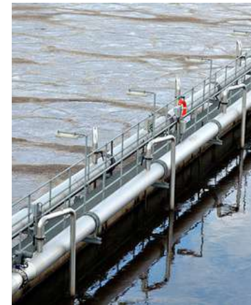
Operación y mantenimiento