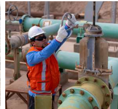
REDES DE DISTRIBUCIÓN